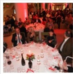
CENA AUGURI 2015 PALLACANESTRO REGGIANA GRISSIN BON