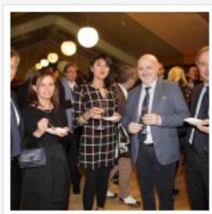
CENA AUGURI 2015 PALLACANESTRO REGGIANA GRISSIN BON