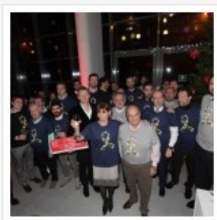
CENA AUGURI 2015 PALLACANESTRO REGGIANA GRISSIN BON SQUADRA E DIRIGENTI CON MAGLIETTA FONDAZIONE KAUKENAS

Il club ringrazia, oltre al catering di I Love My Kitchen, Cantine Riunite per i vini e Pasticceria Poli che ha offerto uno splendido e delizioso dolce, tutte le aziende che hanno collaborato nell'organizzazione della serata: Casamatti e Cilloni Verde per gli allestimenti, Menozzi Home, Grissin Bon e Solimè – La tradizione erboristica per gli omaggi agli ospiti e Davide Draghi di Teletricolore per le immagini che hanno accompagnato la serata.