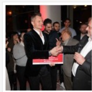
CENA AUGURI 2015 PALLACANESTRO REGGIANA GRISSIN BON LANDI DONAZIONE FONDAZIONE KAUKENAS