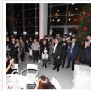
CENA AUGURI 2015 PALLACANESTRO REGGIANA GRISSIN BON