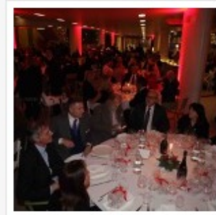
CENA AUGURI 2015 PALLACANESTRO REGGIANA GRISSIN BON